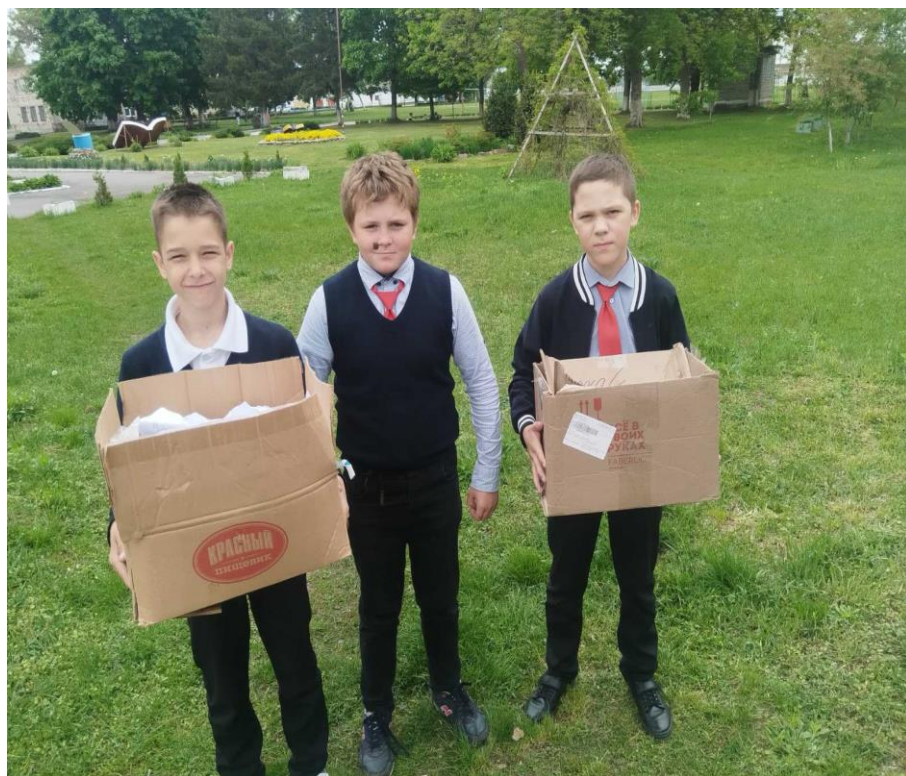
5. Организован сбор пластика.