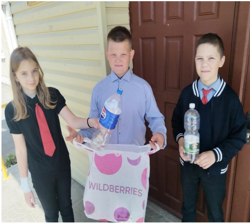
6. Акция «Нам уютно на школьном дворе»