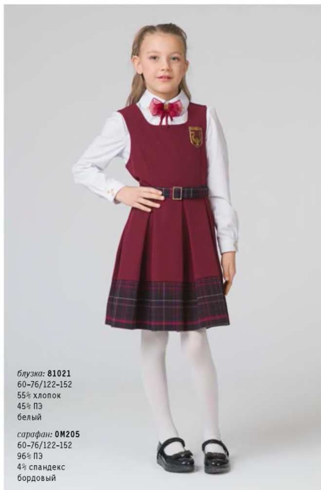
блузка: 81021 60-76/122-152 55% хлопок 45% ПЭ белый сарафан: 0M205 60-76/122-152 96% ПЭ 4% спандекс бордовый

Изделия дополнены шевронами и декоративными элементами в виде бабочки и галстука .