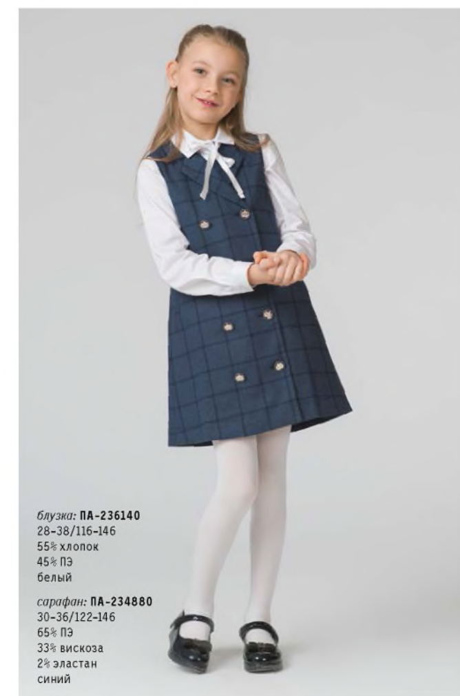
блузка: ПА-236140 28-38/116-146 55% хлопок 45% ПЭ белый сарафан: ПА-234880 30-36/122-146 65% ПЭ 33% вискоза 2% эластан синий