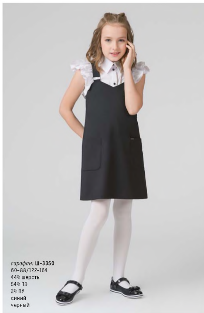
сарафан: Ш-3350 60-88/122-164 44% шерсть 54% ПЭ 2% ПУ синий черный