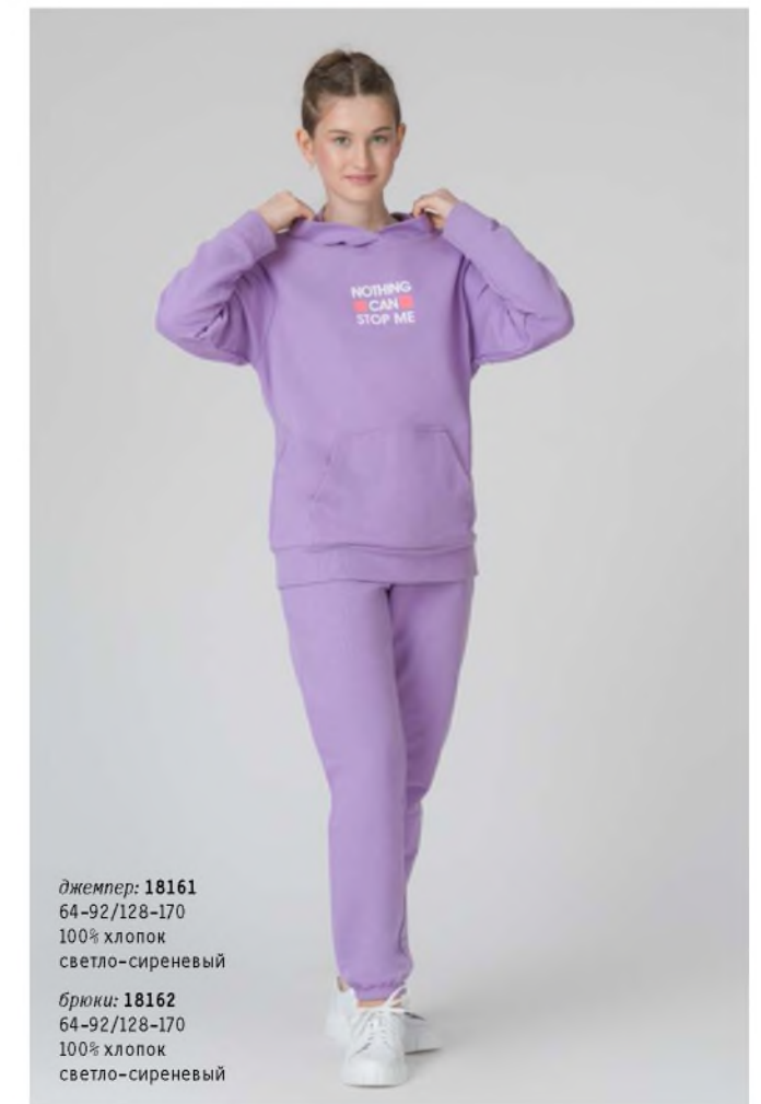
Джемпер: 18161 64-92/128-170 100% хлопок светло-сиреневый Брюки: 18162 64-92/128-170 100% хлопок светло-сиреневый