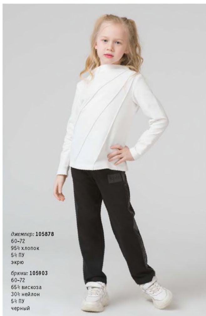
джерсер: 105878 60-72 95% хлопок 5% ПУ экрю брюки: 105903 60-72 65% вискоза 30% нейлон 5% ПУ черный