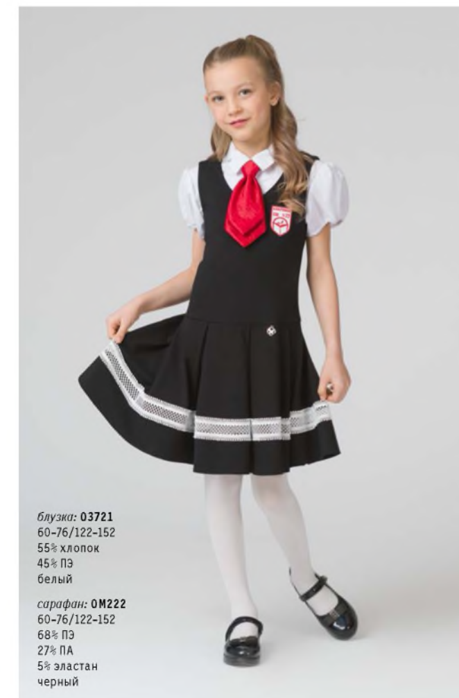
блузка: 03721 60-76/122-152 55% хлопок 45% ПЭ белый сарафан: 0M222 60-76/122-152 68% ПЭ 27% ПА 5% эластан черный