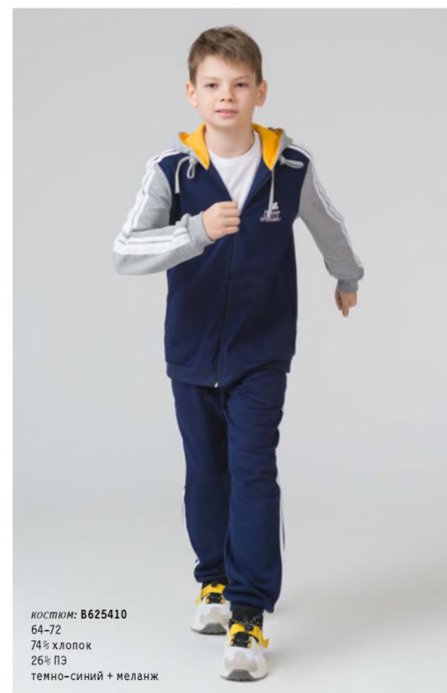
костюм: В625410 64-72 74% хлопок 26% ПЭ темно-синий + меланж