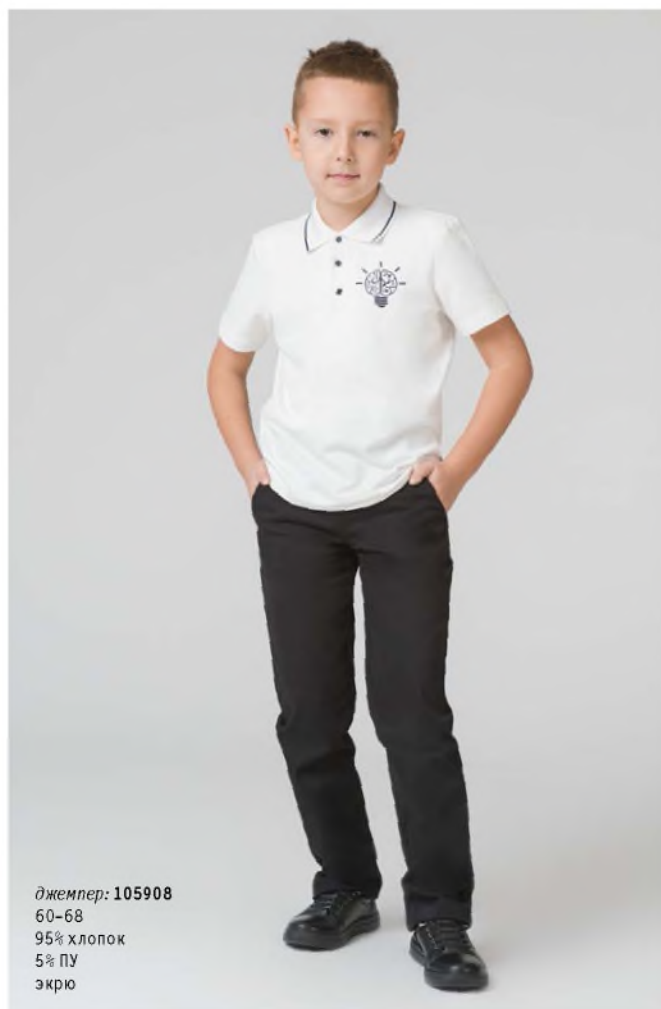
джерсер: 105908 60-68 95% хлопок 5% ПУ экрю