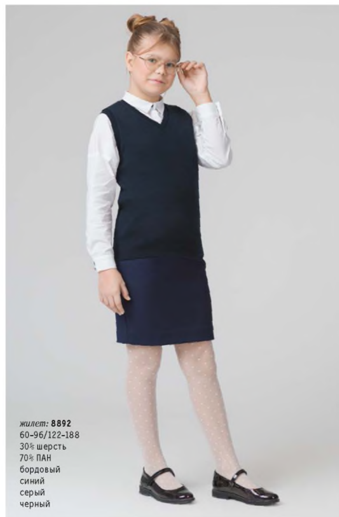
жилет: 8892 60-96/122-188 30% шерсть 70% ПАН бордовый синий серый черный

Качество продукции ОАО «Алеся» отвечает самым высоким Европейским критериям.