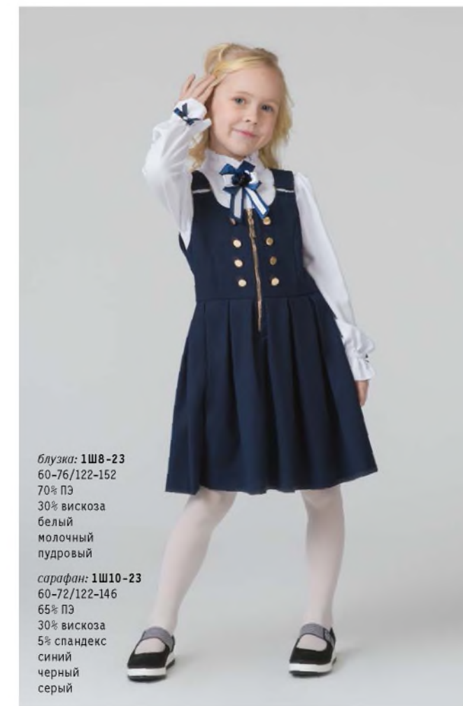
блузка: 1Ш8-23 60-76/122-152 70% ПЭ 30% вискоза белый молочный пудровый сарафан: 1Ш10-23 60-72/122-146 65% ПЭ 30% вискоза 5% спандекс синий черный серый