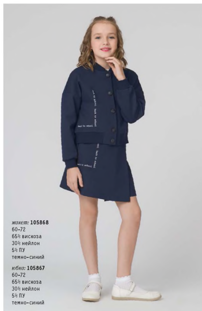
жакет: 105868 60-72 65% вискоза 30% нейлон 5% ПУ темно-синий юбка: 105867 60-72 65% вискоза 30% нейлон 5% ПУ темно-синий