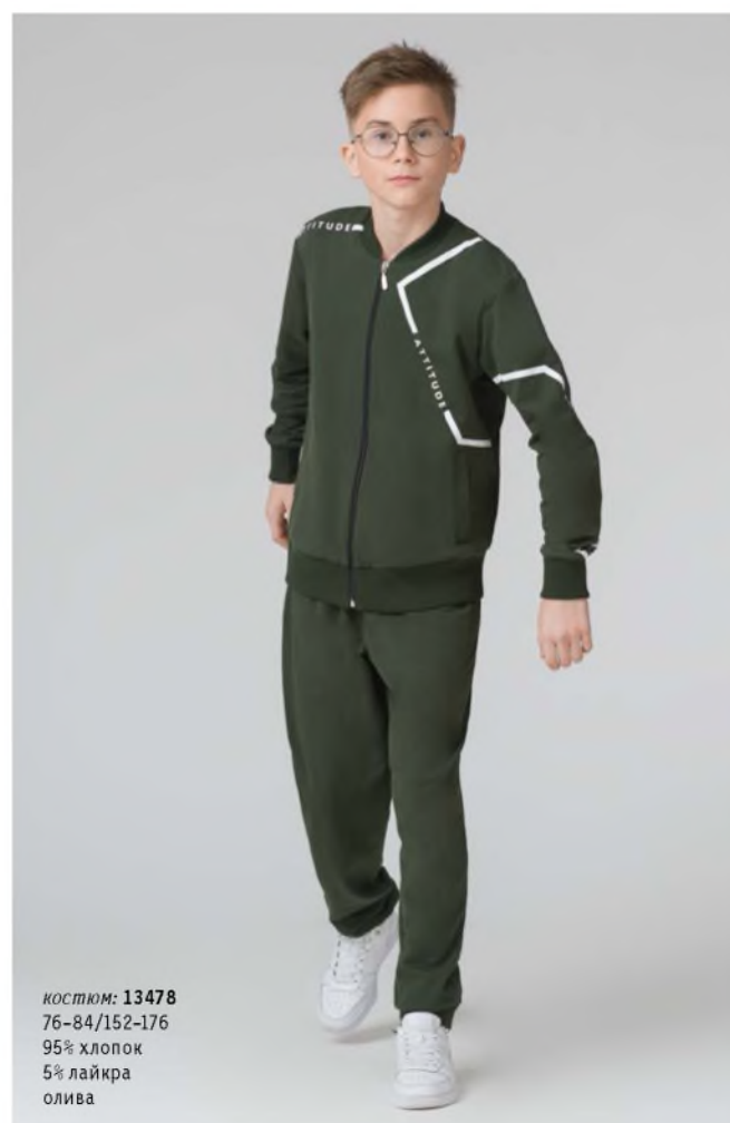
костюм: 13478 76-84/152-176 95% хлопок 5% лайкра олива

«ТОК» – энергия, импульс, движение, заряд.