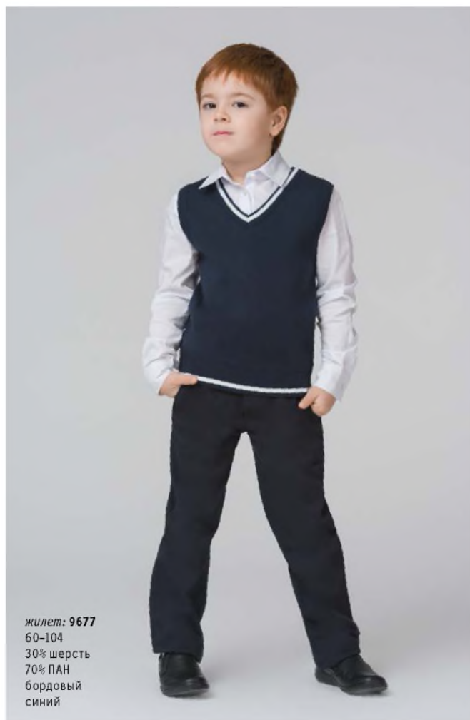
жилет: 9677 60-104 30% шерсть 70% ПАН бордовый синий