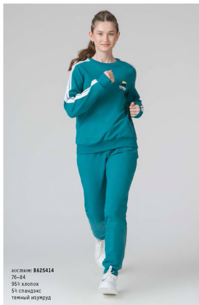
костюм: В625414 76-84 95% хлопок 5% спандэкс темный изумруд

Коллекция представлена актуальными практичными спортивными костюмами. Модели отличаются современным дизайном, удобными конструкциями, полотном, хорошо сохраняющим форму и насыщенность цвета. В качестве отделки используются молнии, канты и штучные печати.