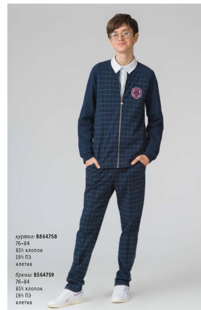
куртка: B864758 76-84 81% хлопок 19% ПЭ клетка