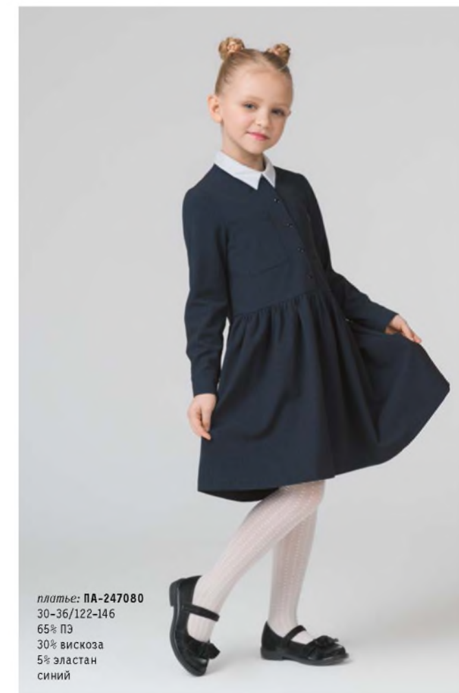
платье: ПА-247080 30-36/122-146 65% ПЭ 30% вискоза 5% эластан синий