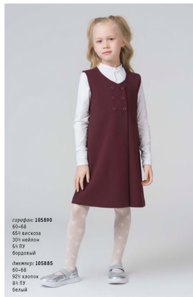
сарафан: 105890 60-68 65% вискоза 30% нейлон 5% ПУ бордовый