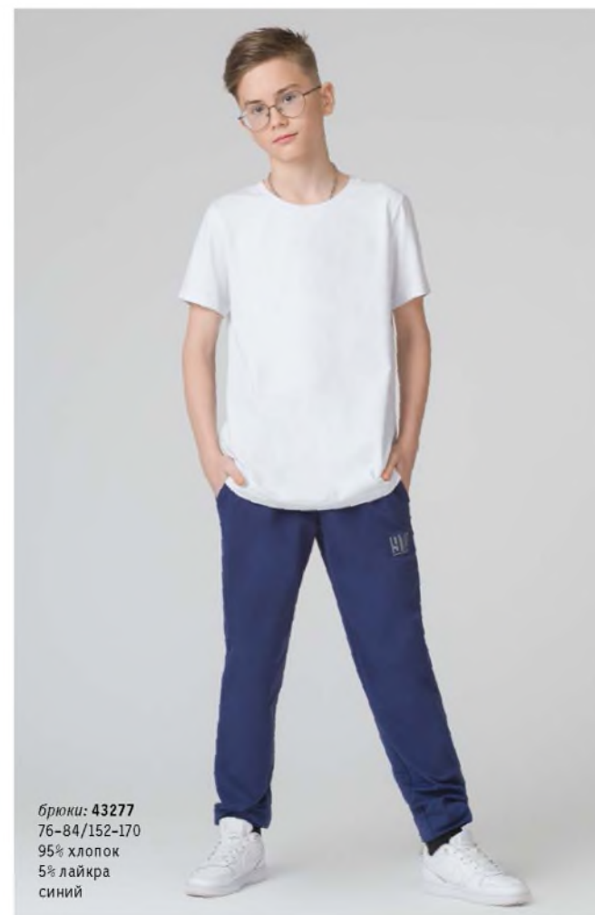
брюки: 43277 76-84/152-170 95% хлопок 5% лайкра синий