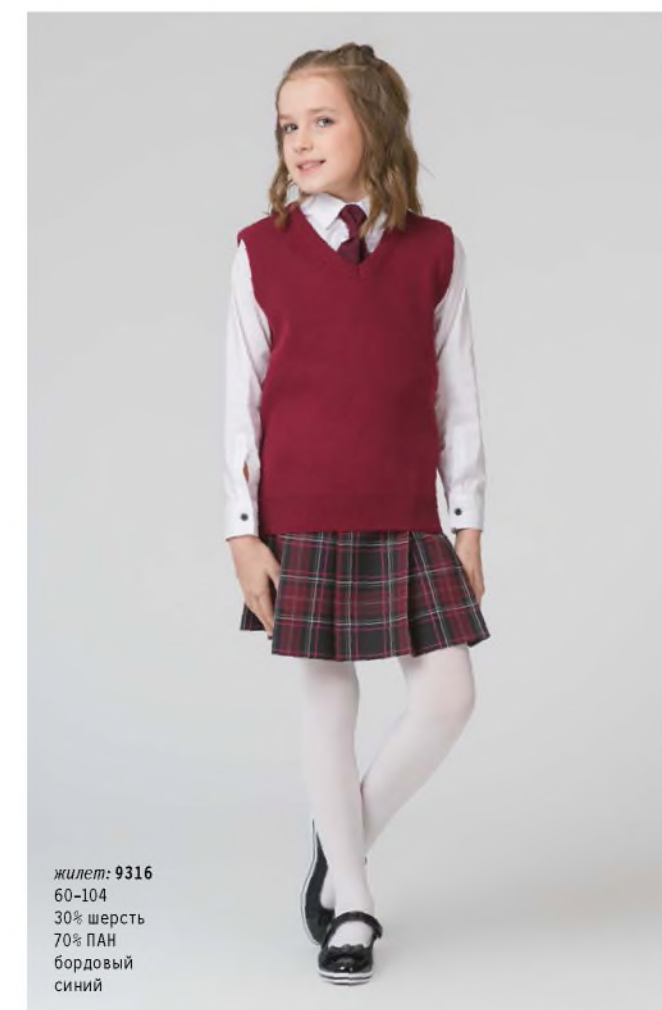
жилет: 9316 60-104 30% шерсть 70% ПАН бордовый синий