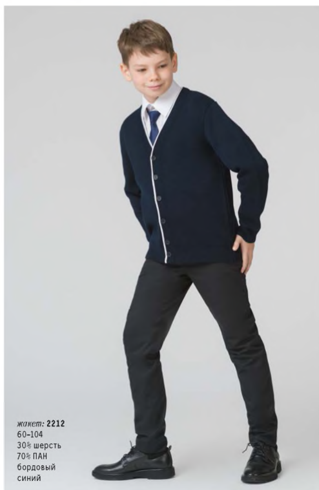
жакет: 2212 60-104 30% шерсть 70% ПАН бордовый синий