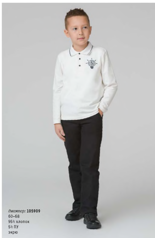
джерсер: 105909 60-68 95% хлопок 5% ПУ экрю