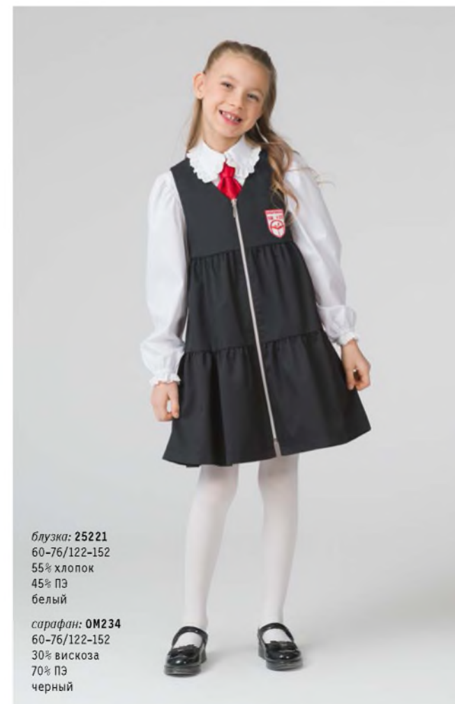
блузка: 25221 60-76/122-152 55% хлопок 45% ПЭ белый сарафан: 0M234 60-76/122-152 30% вискоза 70% ПЭ черный