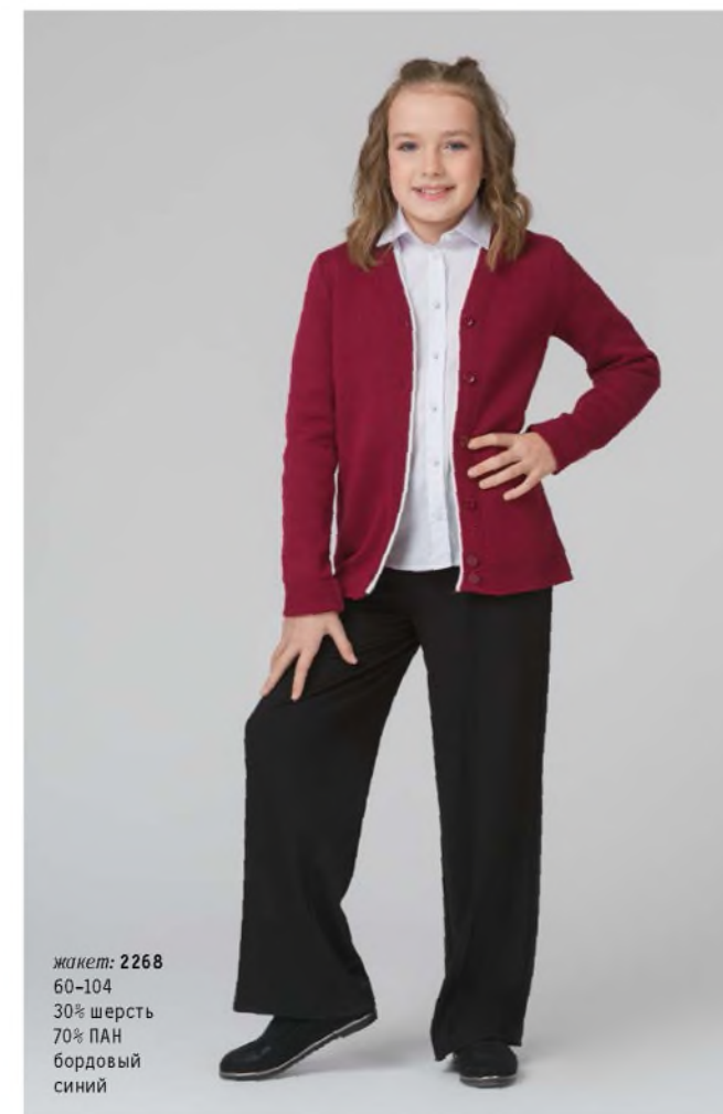
жакет: 2268 60-104 30% шерсть 70% ПАН бордовый синий

Коллекция состоит из изделий для девочек и мальчиков в классических расцветках. Правильный крой и эластичные ткани идеально подходят на любую комплекцию и помогают правильно расставлять акценты. Безупречное качество делает одежду удобной и практичной в ежедневной носке.