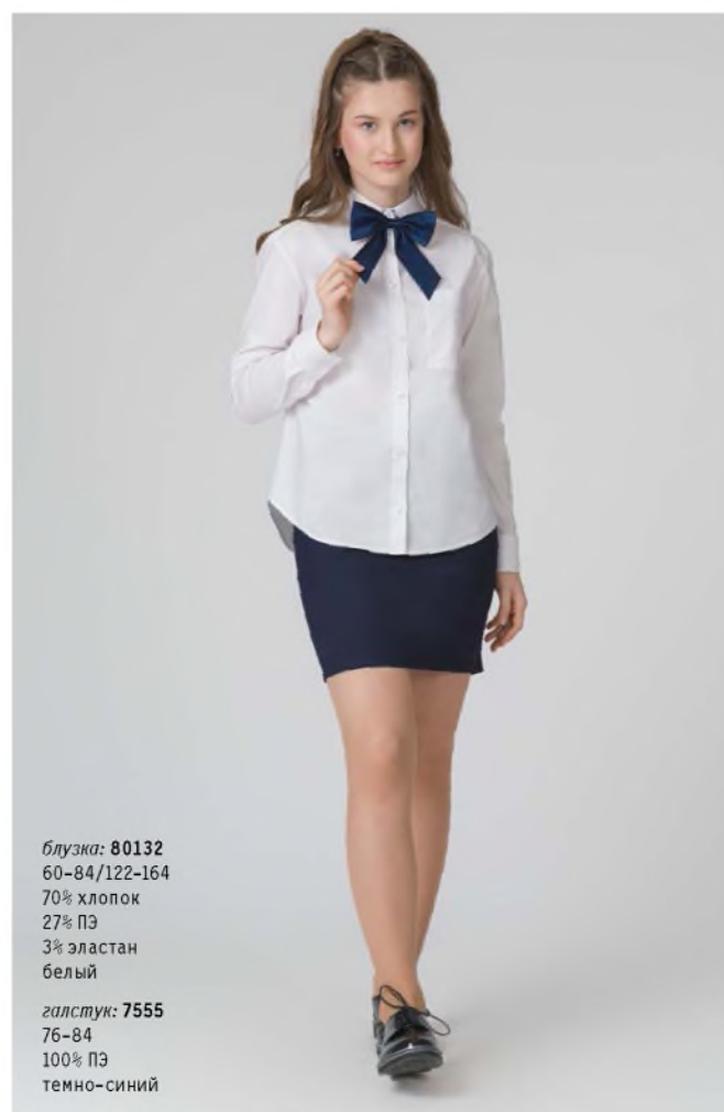
блузка: 80132 60-84/122-164 70% хлопок 27% ПЭ 3% эластан белый галстук: 7555 76-84 100% ПЭ темно-синий