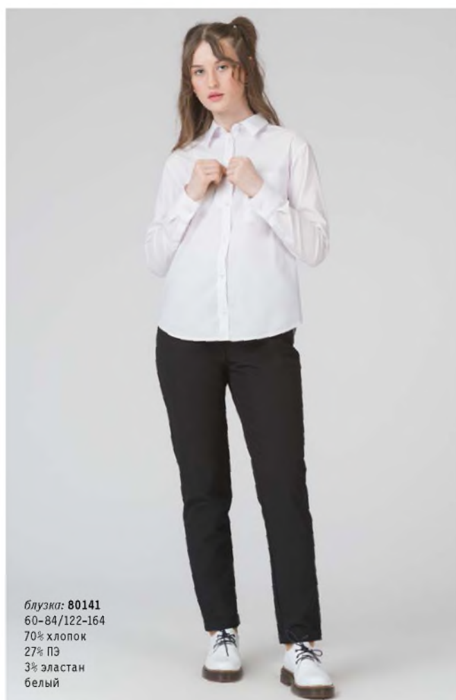
блузка: 80141 60-84/122-164 70% хлопок 27% ПЭ 3% эластан белый

Одежда SILVER GREY – это не просто одежда, а способ поиска своей индивидуальности и самовыражения.