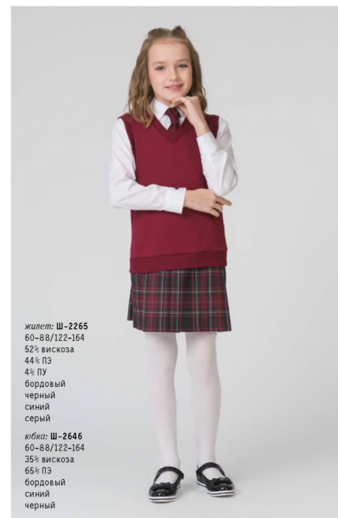
жилет: Ш-2265 60-88/122-164 52% вискоза 44% ПЭ 4% ПУ бордовый черный синий серый юбка: Ш-2646 60-88/122-164 35% вискоза 65% ПЭ бордовый синий черный