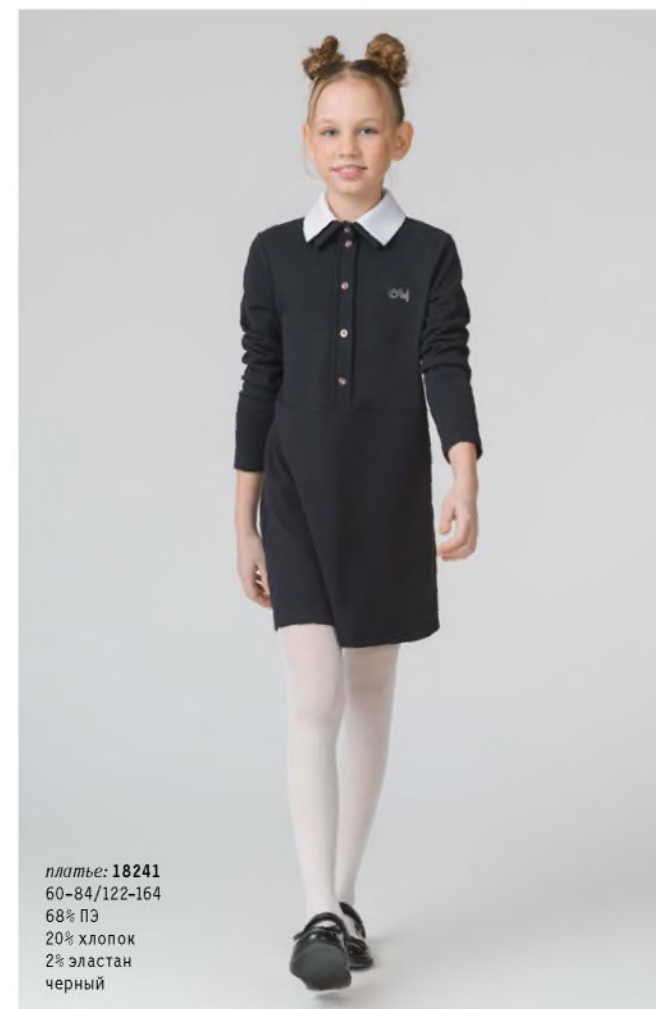
платье: 18241 60-84/122-164 68% ПЭ 20% хлопок 2% эластан черный