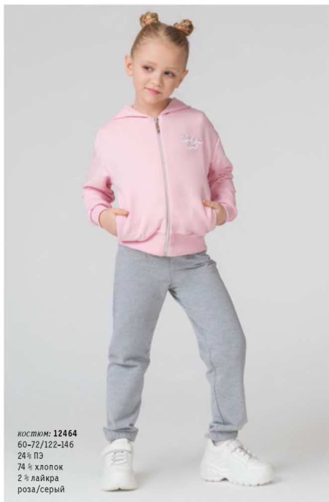
костюм: 12464 60-72/122-146 24% ПЭ 74% хлопок 2% лайкра роза/серый