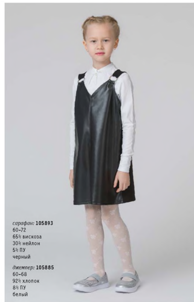
сарафан: 105893 60-72 65% вискоза 30% нейлон 5% ПУ черный джерсера: 105885 60-68 92% хлопок 8% ПУ белый

В школьной коллекции ОАО «КУПАЛИНКА» представлены джерсера в сочетании с сарафанами , жилетами , брюками , юбками , а также платьями базового кроя из трикотажных полотен. Модели имеют максимально простой и лаконичный дизайн: выполнены в строгой гамме, имеют прямой силуэт. Трикотажные джерсера — отличный вариант на каждый день. Каждый из них одинаково хорошо сочетается как с классическими моделями, так и с выполненными в спортивном стиле.