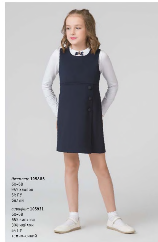
джерсер: 105886 60-68 95% хлопок 5% ПУ белый сарфан: 105931 60-68 65% вискоза 30% нейлон 5% ПУ темно-синий