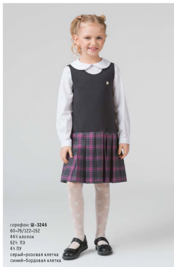
сарафан: Ш-3246 60-76/122-152 44% хлопок 52% ПЭ 4% ПУ серый-розовая клетка синий-бордовая клетка