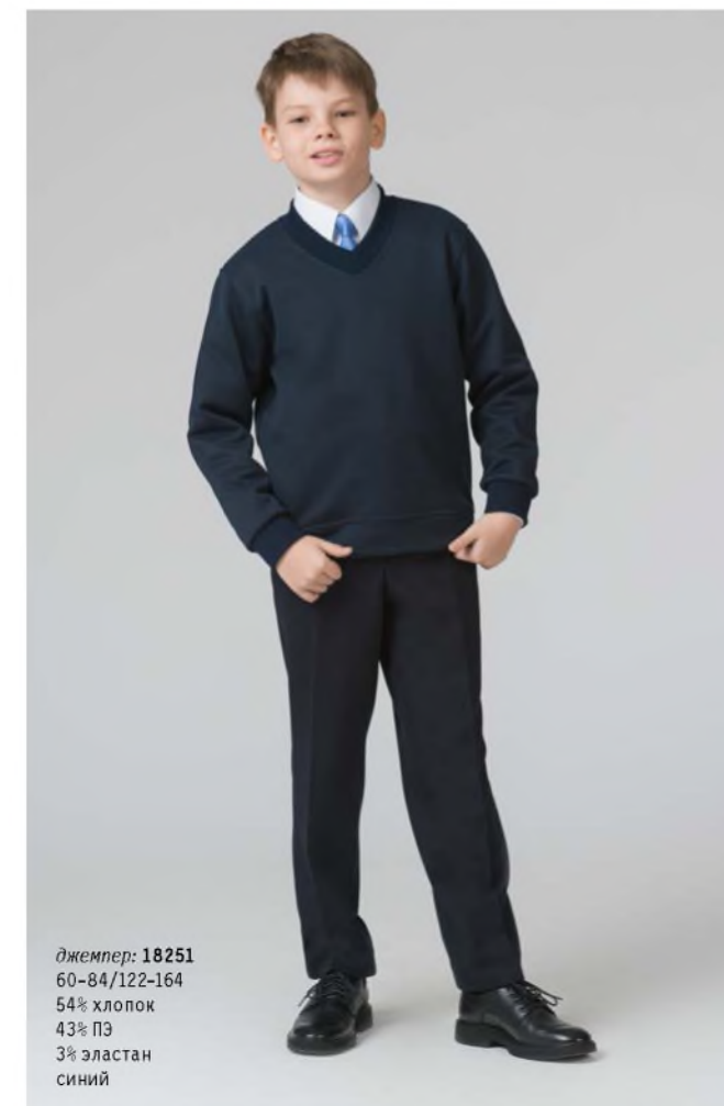
джерсер: 18251 60-84/122-164 54% хлопок 43% ПЭ 3% эластан синий