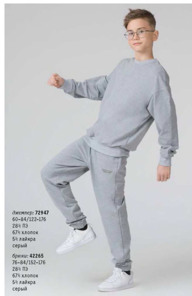
джерсер: 72947 60-84/122-176 28% ПЭ 67% хлопок 5% лайкра серый брюки: 42265 76-84/152-176 28% ПЭ 67% хлопок 5% лайкра серый