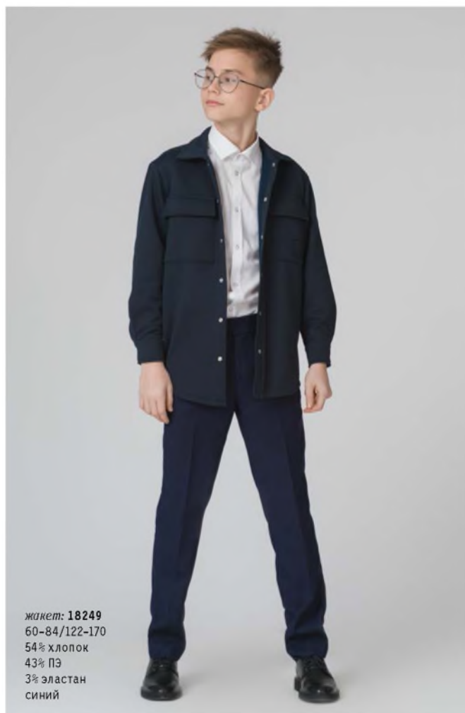
жакет: 18249 60-84/122-170 54% хлопок 43% ПЭ 3% эластан синий

Школьная коллекция ОАО «8 Марта» разработана для стильных и гармоничных учеников. Отличается современным дизайном, комфортом, сочетанием в одежде урбанистической культуры, «взрослой деловой» классики и элементов подростковой непосредственности. Коллекция включает как деловую одежду для школы "School", так и спортивную «Физ-ра».