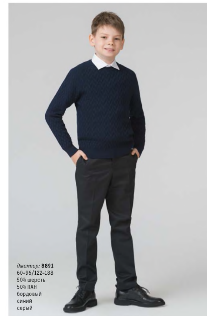
джерсер: 8891 60-96/122-188 50% шерсть 50% ПАН бордовый синий серый