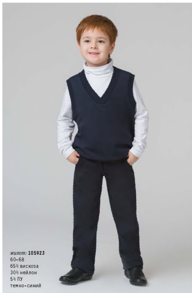
жилет: 105923 60-68 65% вискоза 30% нейлон 5% ПУ темно-синий