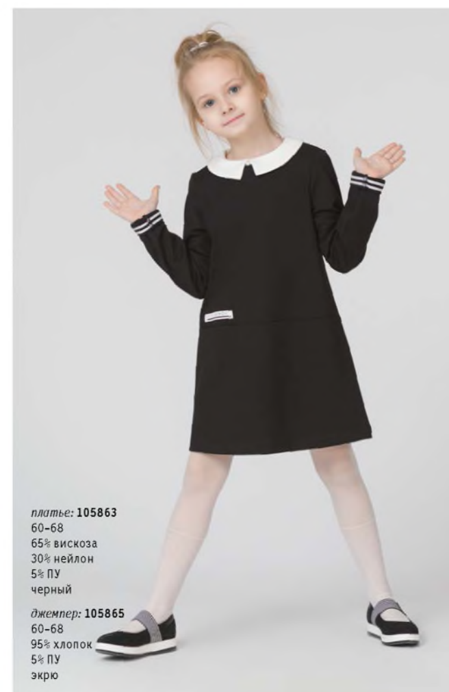
платье: 105863 60-68 65% вискоза 30% нейлон 5% ПУ черный