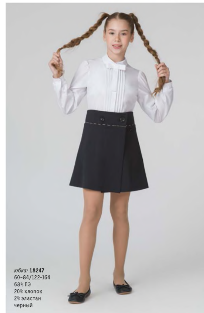
юбка: 18247 60-84/122-164 68% ПЭ 20% хлопок 2% эластан черный