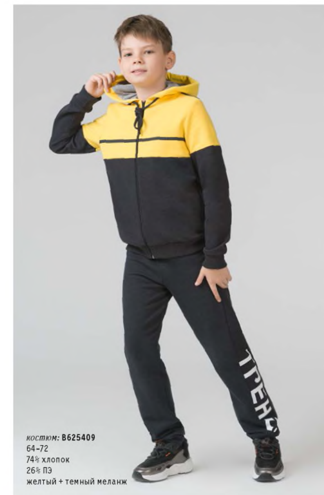
костюм: В625409 64-72 74% хлопок 26% ПЭ желтый + темный меланж