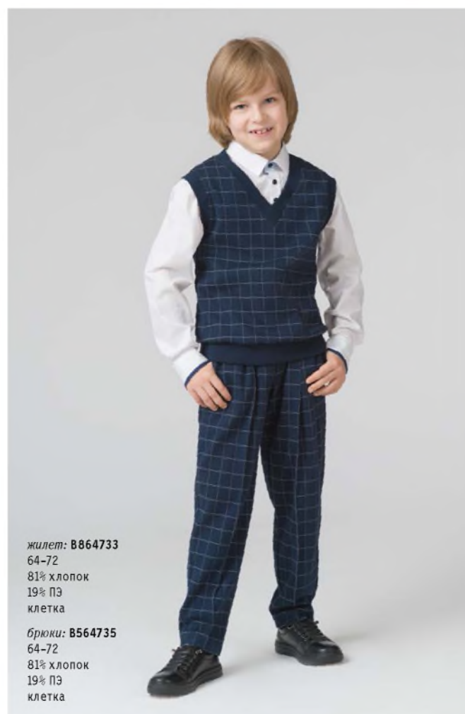
жилет: B864733 64-72 81% хлопок 19% ПЭ клетка

Одежда ОАО «СВІТАНАК» сочетает в себе современность, модный дизайн и высокое качество изделий по доступным ценам. Универсальность наших коллекций позволяет легко и просто комбинировать модели друг с другом и всегда выглядеть стильно и уверенно.