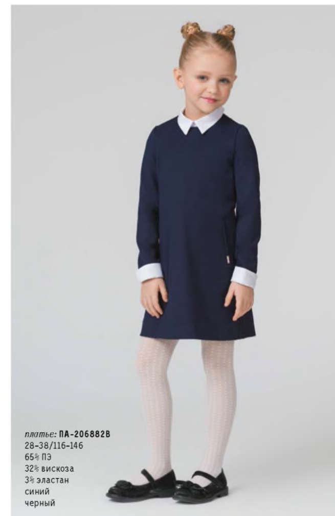
платье: ПА-206882В 28-38/116-146 65% ПЭ 32% вискоза 3% эластан синий черный

Коллекция выполнена из классической для школьной моды ткани на основе хлопка с добавлением полимерных волокон для повышения износостойкости и практичности.