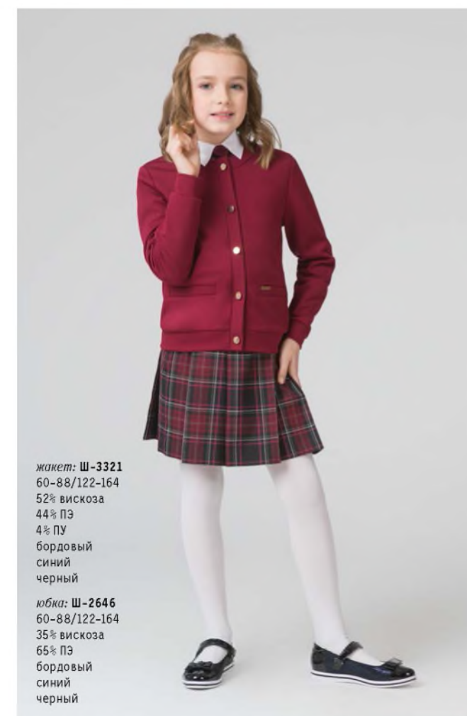
жакет: Ш-3321 60-88/122-164 52% вискоза 44% ПЭ 4% ПУ бордовый синий черный юбка: Ш-2646 60-88/122-164 35% вискоза 65% ПЭ бордовый синий черный