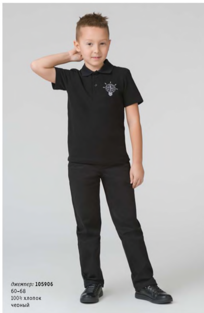
джерсер: 105906 60-68 100% хлопок черный