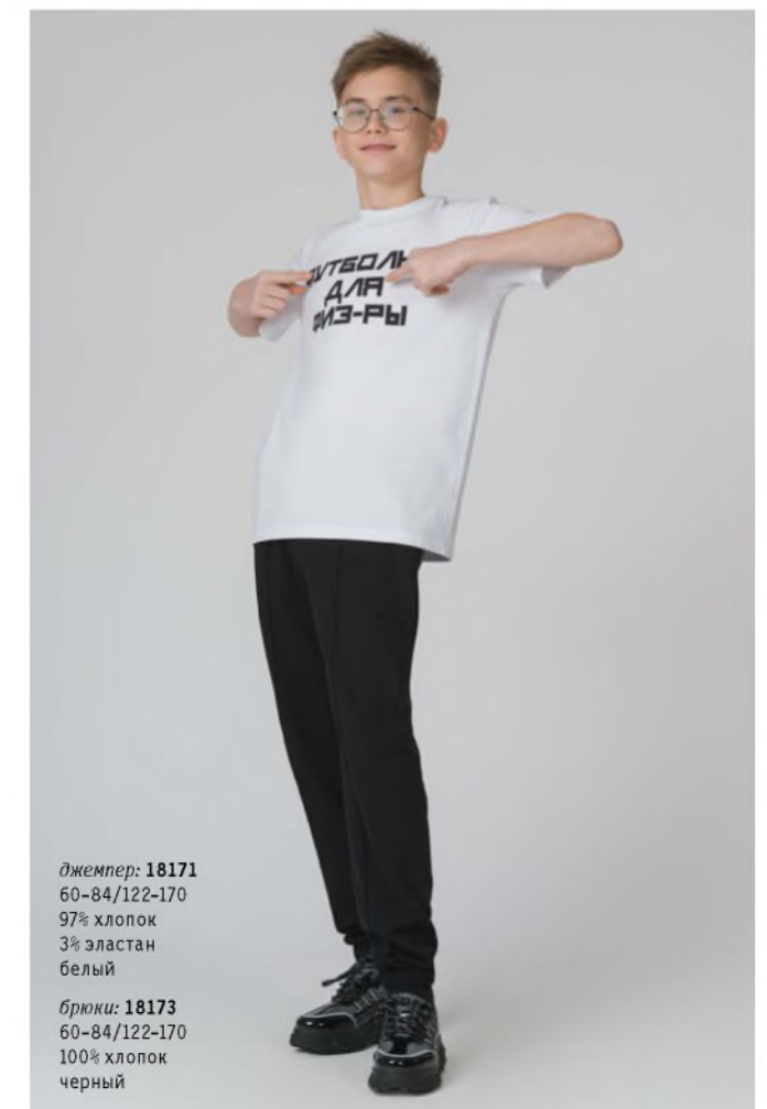
Джемпер: 18171 60-84/122-170 97% хлопок 3% эластан белый Брюки: 18173 60-84/122-170 100% хлопок черный