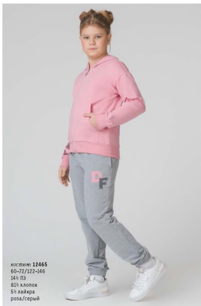
костюм: 12465 60-72/122-146 14% ПЭ 81% хлопок 5% лайкра роза/серый