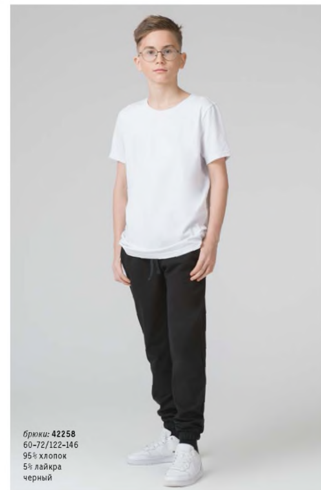
брюки: 42258 60-72/122-146 95% хлопок 5% лайкра черный