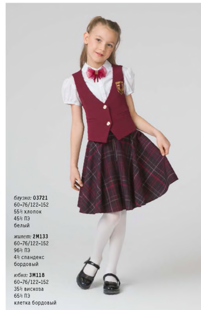
блузка: 03721 60-76/122-152 55% хлопок 45% ПЭ белый жилет: 2M133 60-76/122-152 96% ПЭ 4% спандекс бордовый юбка: 3M118 60-76/122-152 35% вискоза 65% ПЭ клетка бордовый