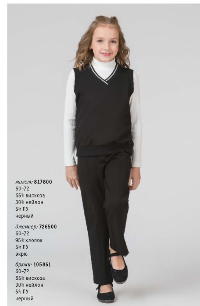
жилет: 817800 60-72 65% вискоза 30% нейлон 5% ПУ черный