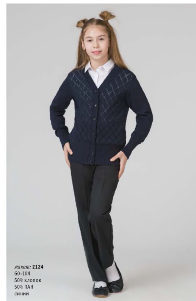
жакет: 2124 60-104 50% хлопок 50% ПАН синий