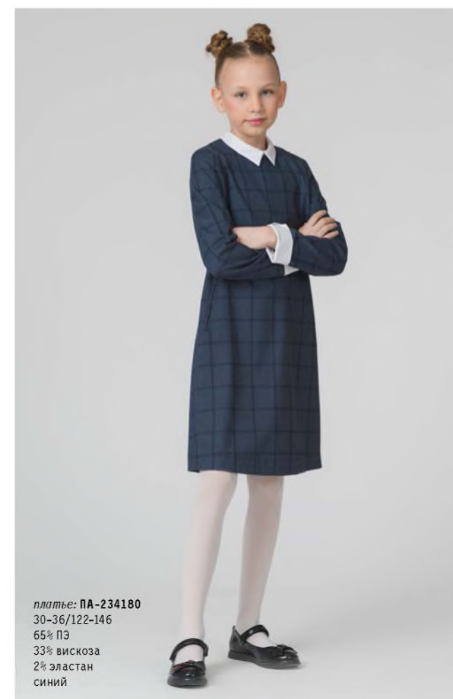
платье: ПА-234180 30-36/122-146 65% ПЭ 33% вискоза 2% эластан синий