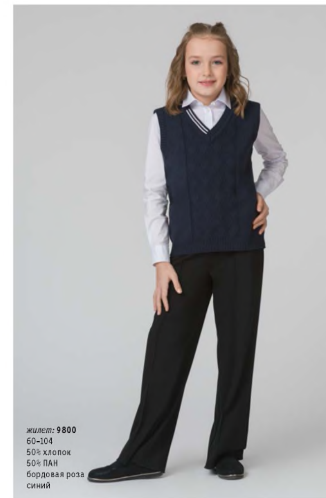
жилет: 9800 60-104 50% хлопок 50% ПАН бордовая роза синий