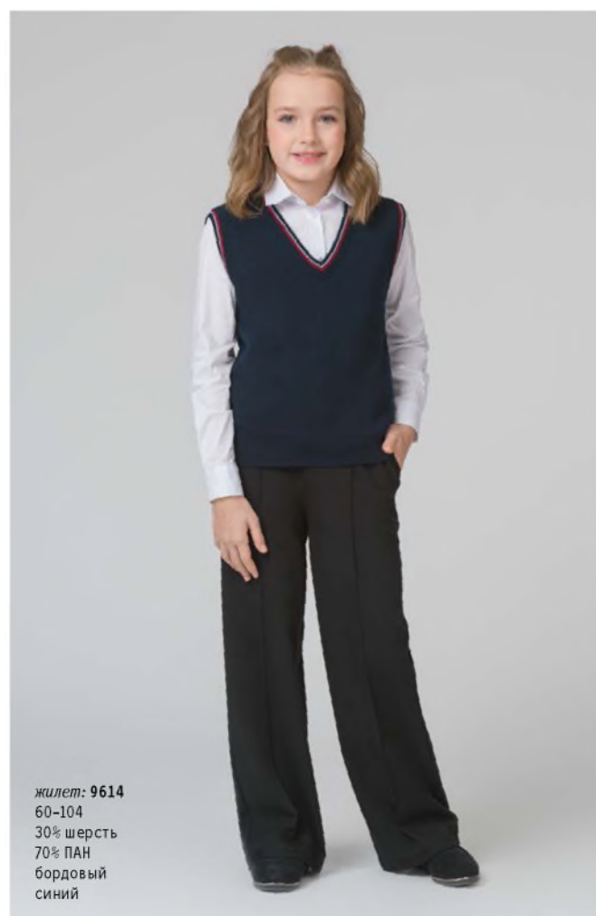
жилет: 9614 60-104 30% шерсть 70% ПАН бордовый синий