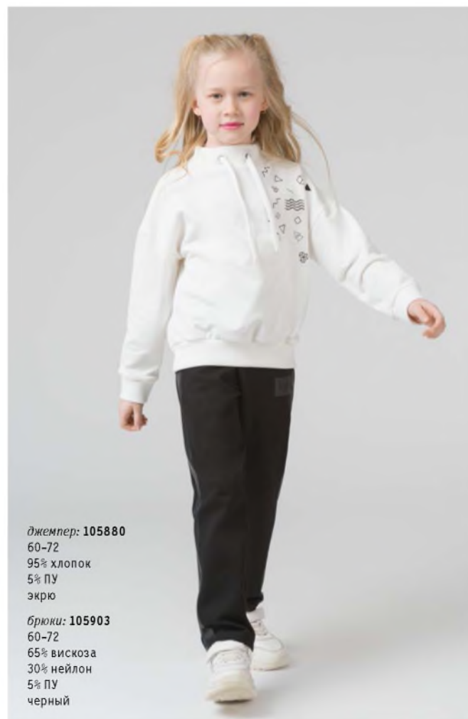
джерсер: 105880 60-72 95% хлопок 5% ПУ экрю брюки: 105903 60-72 65% вискоза 30% нейлон 5% ПУ черный