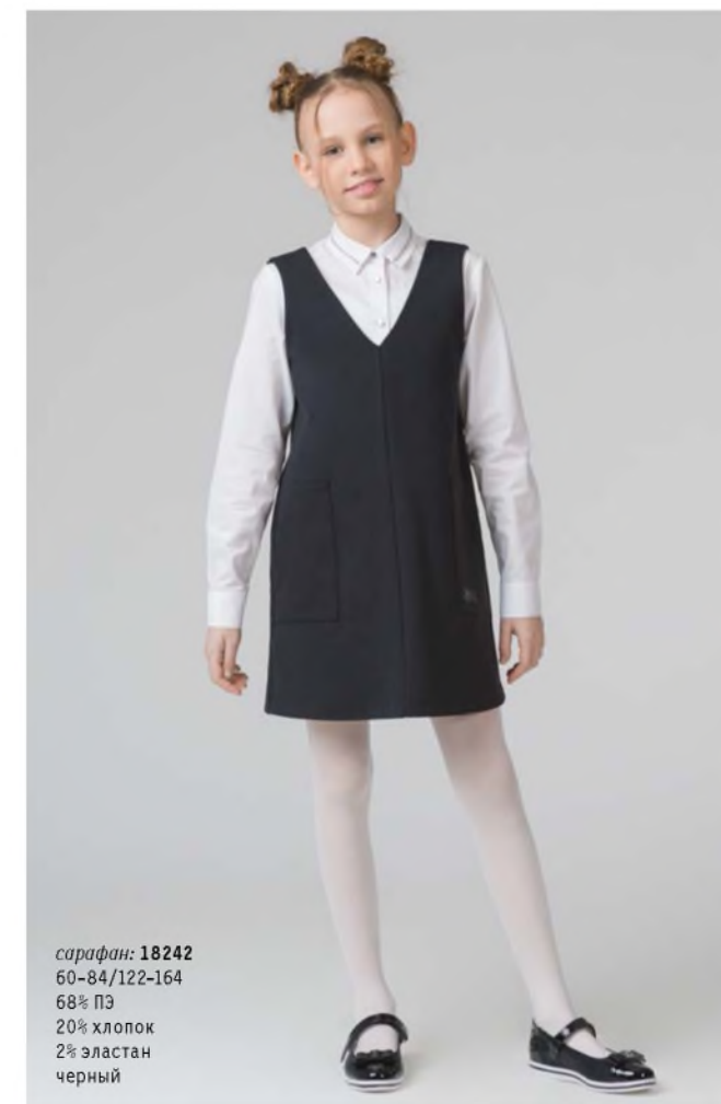
сарфан: 18242 60-84/122-164 68% ПЭ 20% хлопок 2% эластан черный