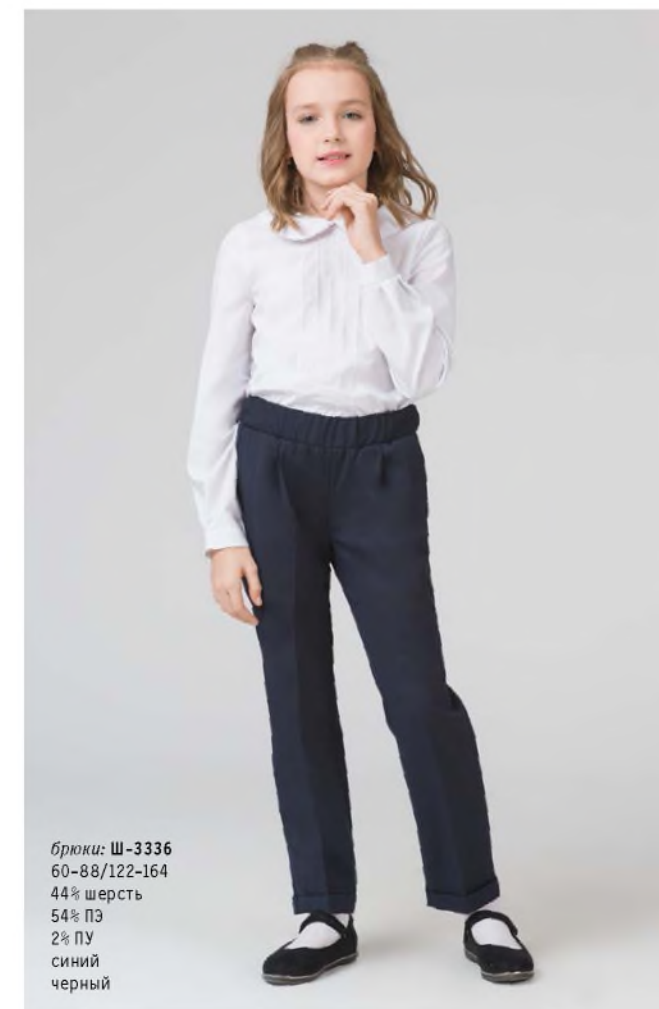
брюки: Ш-3336 60-88/122-164 44% шерсть 54% ПЭ 2% ПУ синий черный