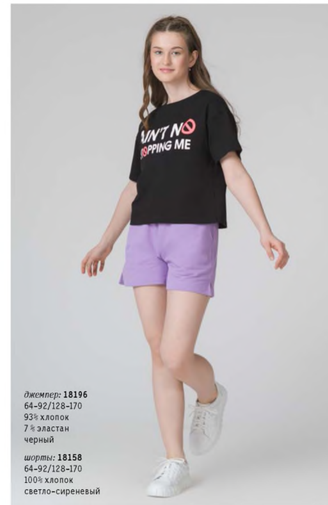
Джемпер: 18196 64-92/128-170 93% хлопок 7% эластан черный шорты: 18158 64-92/128-170 100% хлопок светло-сиреневый