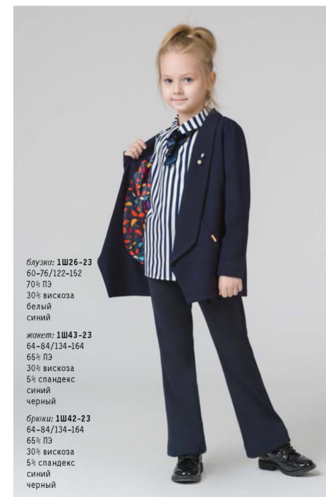
блузка: 1Ш26-23 60-76/122-152 70% ПЭ 30% вискоза белый синий жакет: 1Ш43-23 64-84/134-164 65% ПЭ 30% вискоза 5% спандекс синий черный брюки: 1Ш42-23 64-84/134-164 65% ПЭ 30% вискоза 5% спандекс синий черный