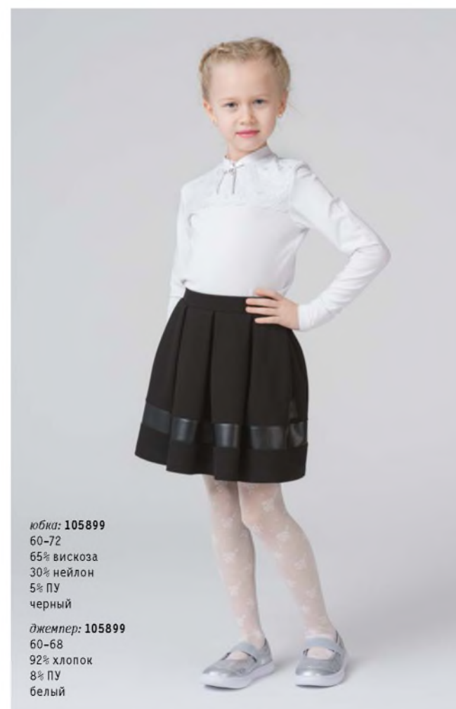
юбка: 105899 60-72 65% вискоза 30% нейлон 5% ПУ черный джерсера: 105899 60-68 92% хлопок 8% ПУ белый