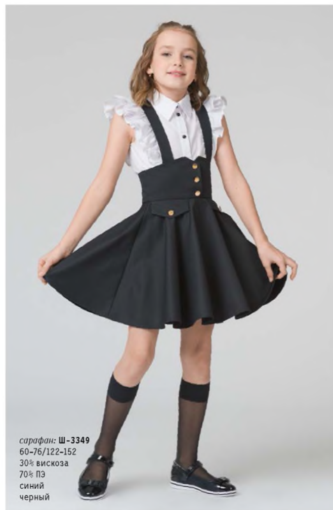
сарафан: Ш-3349 60-76/122-152 30% вискоза 70% ПЭ синий черный