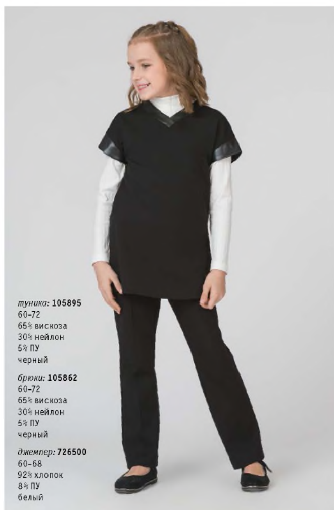
туника: 105895 60-72 65% вискоза 30% нейлон 5% ПУ черный