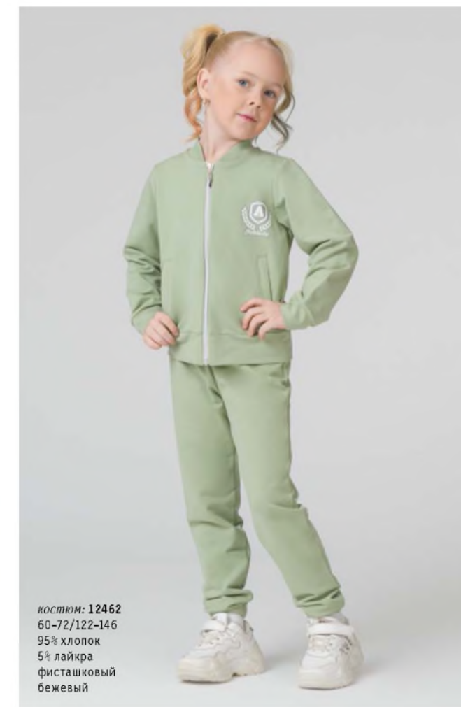
костюм: 12462 60-72/122-146 95% хлопок 5% лайкра фисташковый бежевый