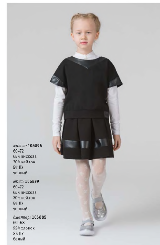
жилет: 105896 60-72 65% вискоза 30% нейлон 5% ПУ черный юбка: 105899 60-72 65% вискоза 30% нейлон 5% ПУ черный джерсера: 105885 60-68 92% хлопок 8% ПУ белый