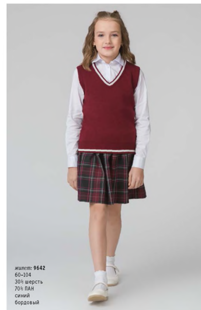
жилет: 9642 60-104 30% шерсть 70% ПАН синий бордовый