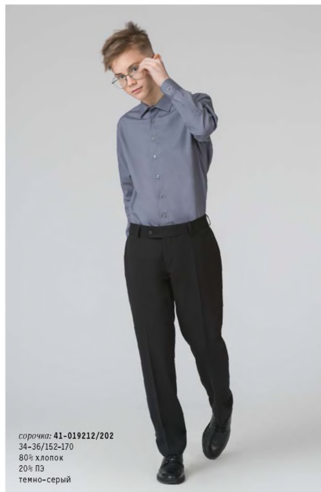
сорочка: 41-019212/202 34-36/152-170 80% хлопок 20% ПЭ темно-серый