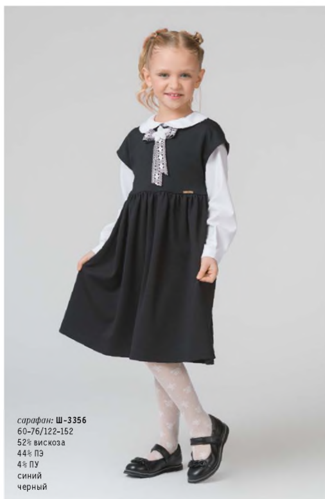
сарафан: Ш-3356 60-76/122-152 52% вискоза 44% ПЭ 4% ПУ синий черный