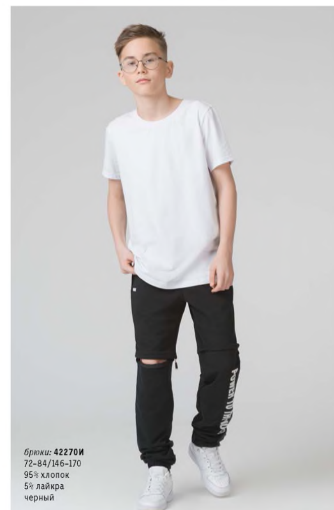
брюки: 42270И 72-84/146-170 95% хлопок 5% лайкра черный