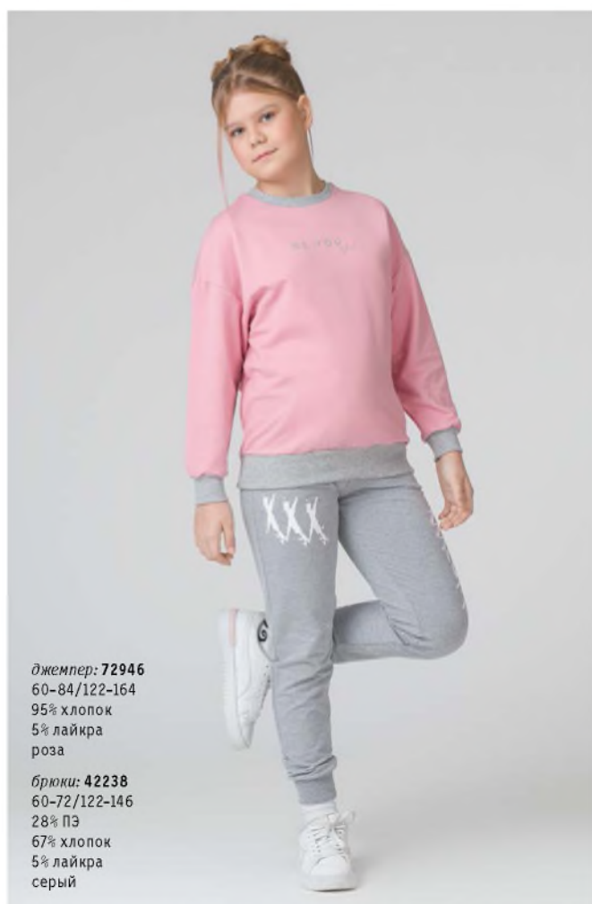
джерсер: 72946 60-84/122-164 95% хлопок 5% лайкра роза брюки: 42238 60-72/122-146 28% ПЭ 67% хлопок 5% лайкра серый