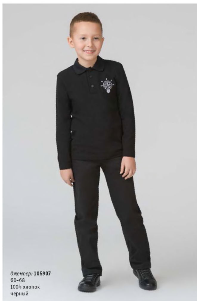
джерсер: 105907 60-68 100% хлопок черный