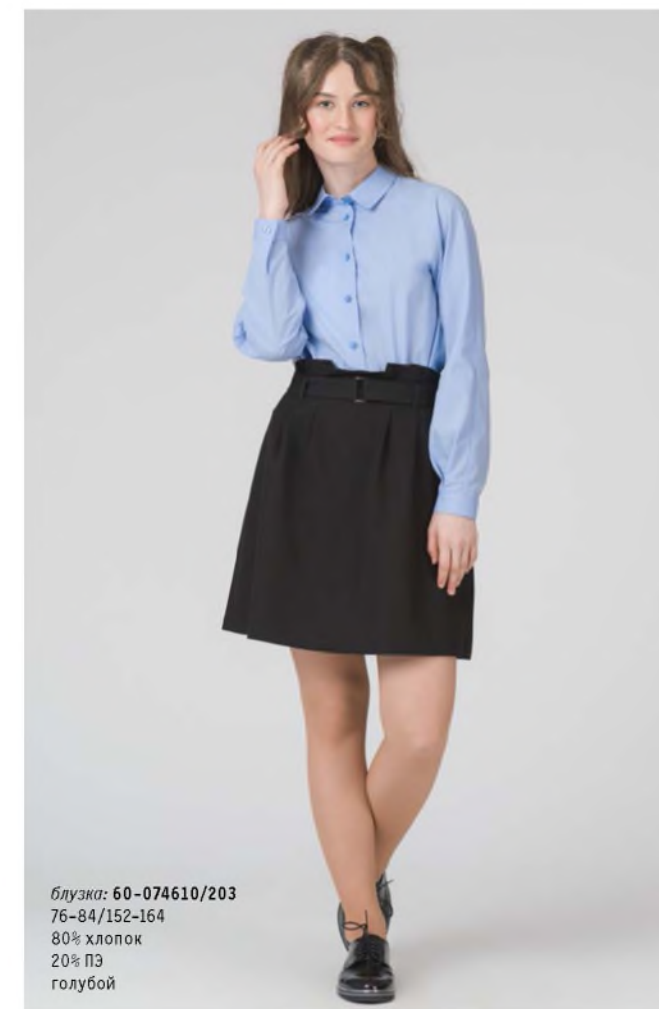
блузка: 60-074610/203 76-84/152-164 80% хлопок 20% ПЭ голубой