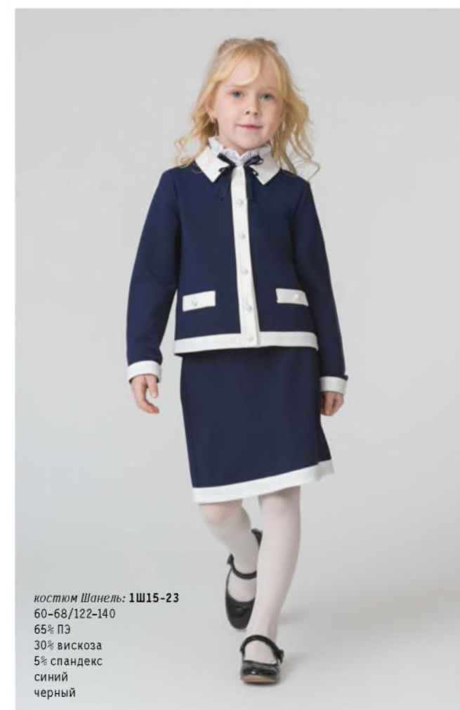
костюм Шанель: 1Ш15-23 60-68/122-140 65% ПЭ 30% вискоза 5% спандекс синий черный