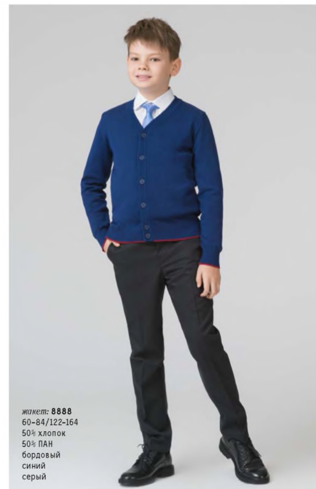
жакет: 8888 60-84/122-164 50% хлопок 50% ПАН бордовый синий серый