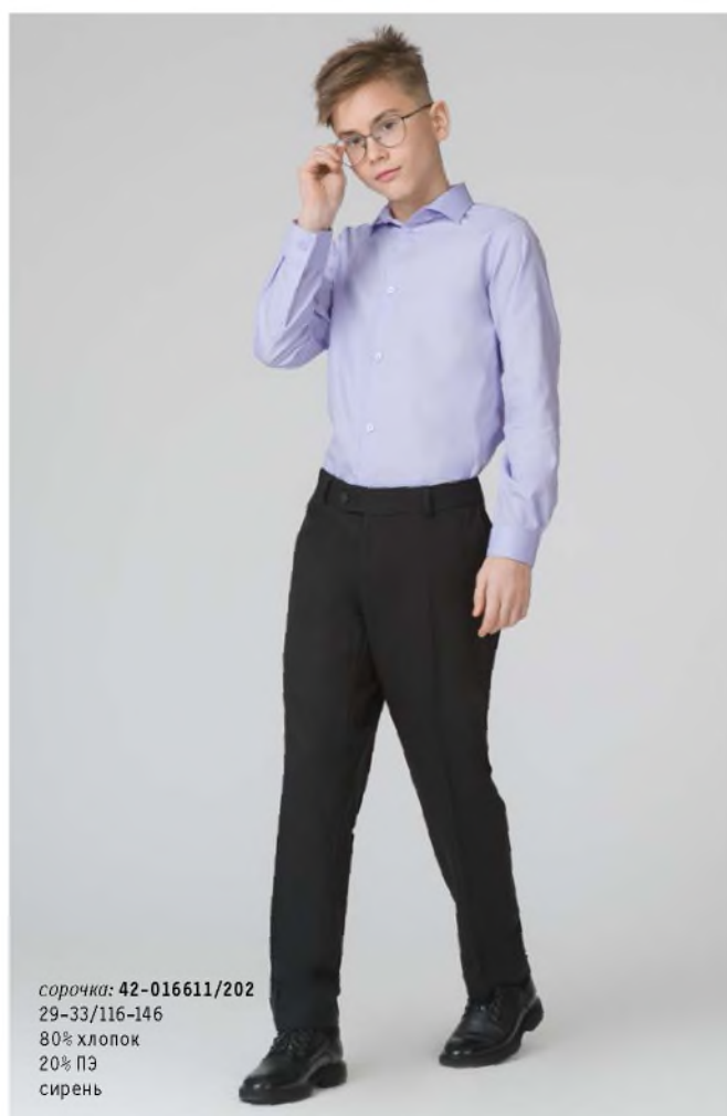
сорочка: 42-016611/202 29-33/116-146 80% хлопок 20% ПЭ сирень