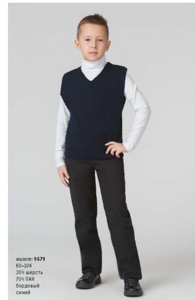
жилет: 9679 60-104 30% шерсть 70% ПАН бордовый синий