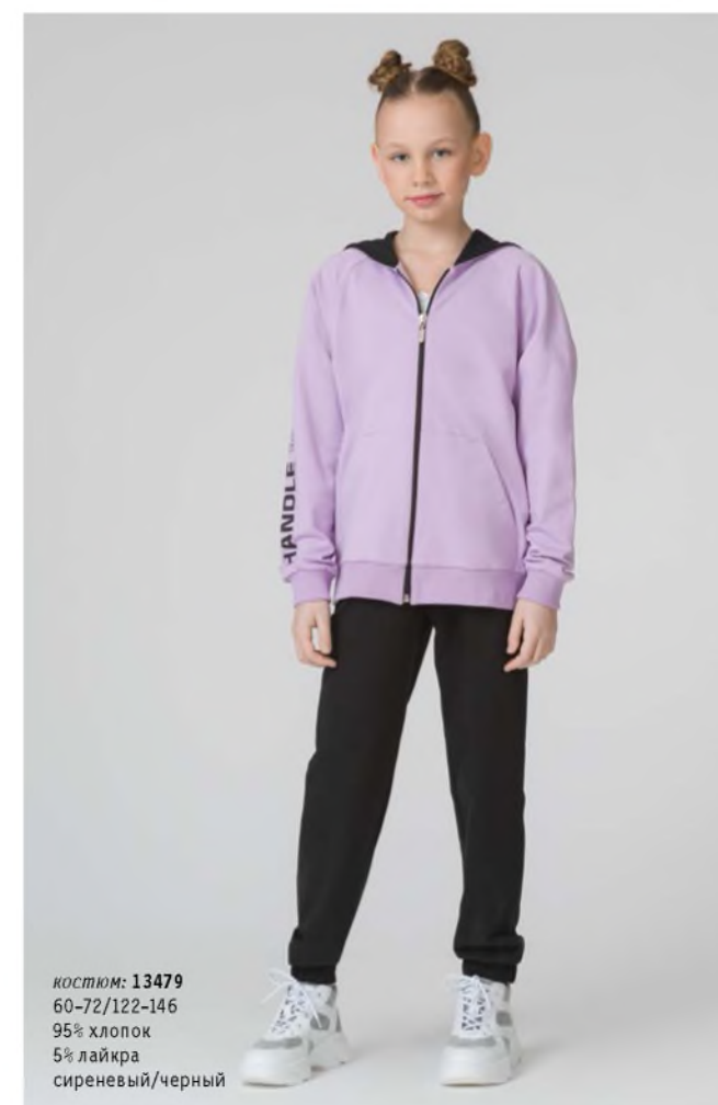
костюм: 13479 60-72/122-146 95% хлопок 5% лайкра сиреневый/черный