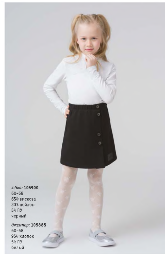
юбка: 105900 60-68 65% вискоза 30% нейлон 5% ПУ черный