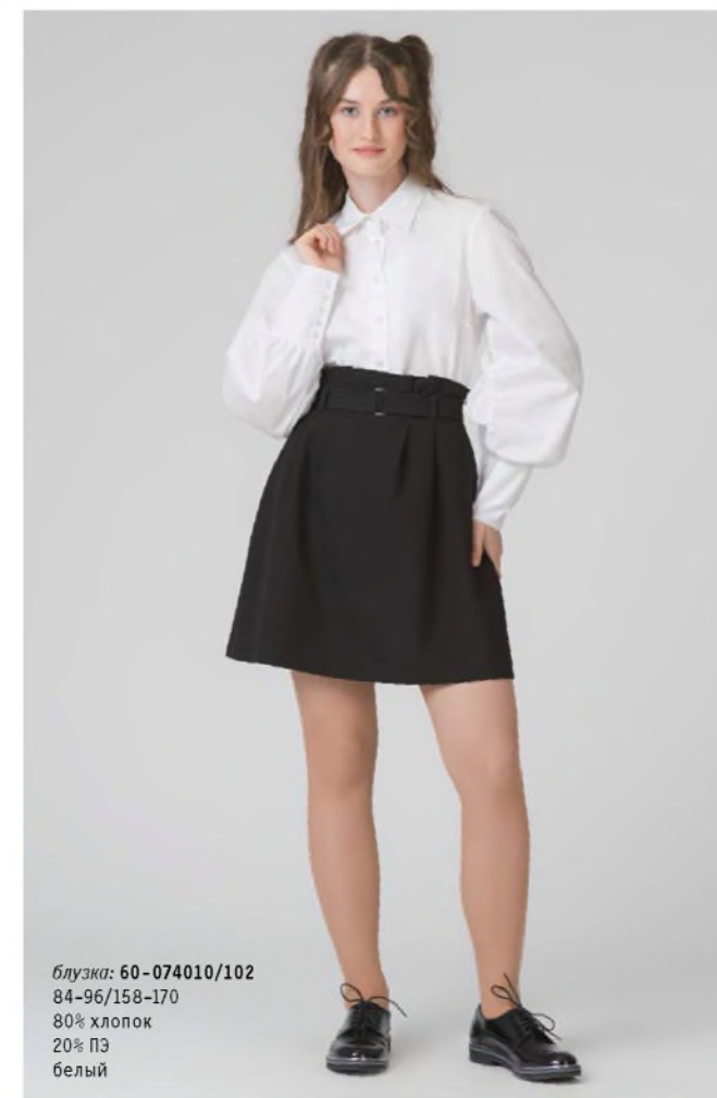
блузка: 60-074010/102 84-96/158-170 80% хлопок 20% ПЭ белый