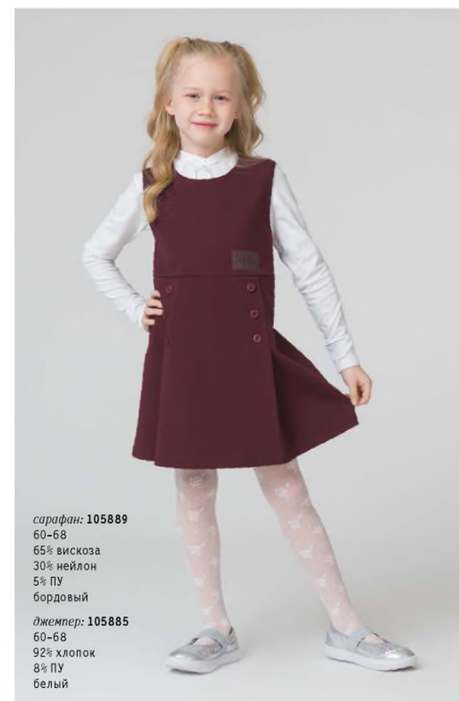
сарафан: 105889 60-68 65% вискоза 30% нейлон 5% ПУ бордовый