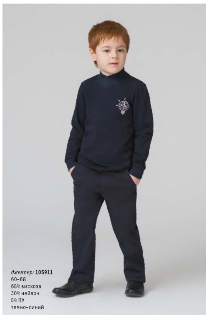
джерсер: 105911 60-68 65% вискоза 30% нейлон 5% ПУ темно-синий