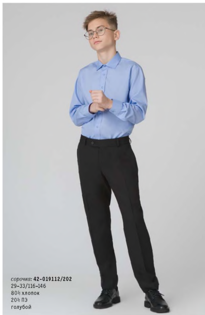
сорочка: 42-019112/202 29-33/116-146 80% хлопок 20% ПЭ голубой