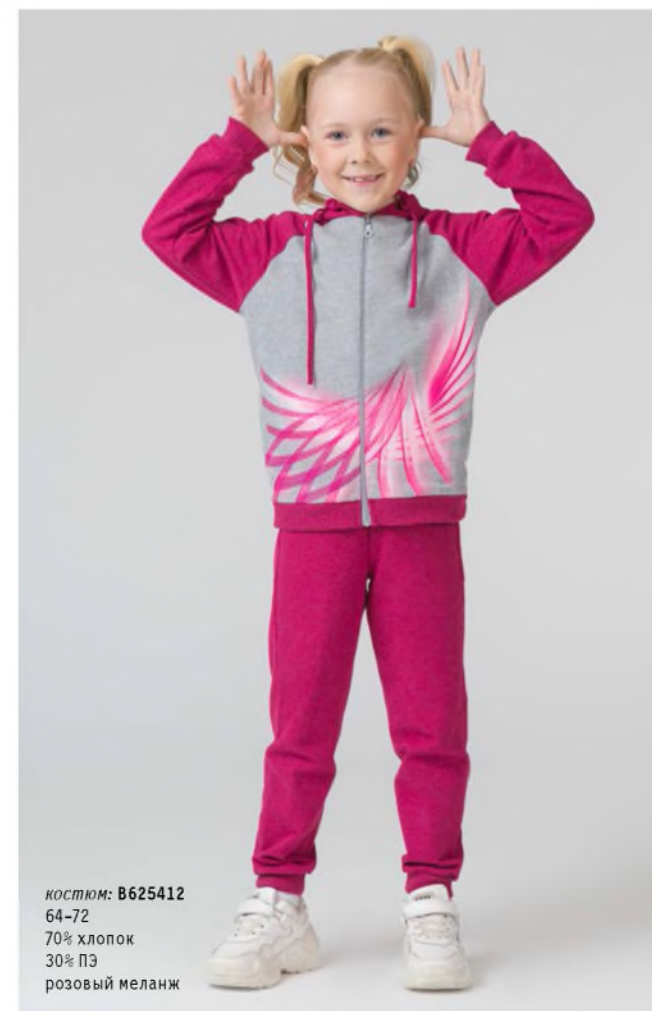
костюм: В625412 64-72 70% хлопок 30% ПЭ розовый меланж