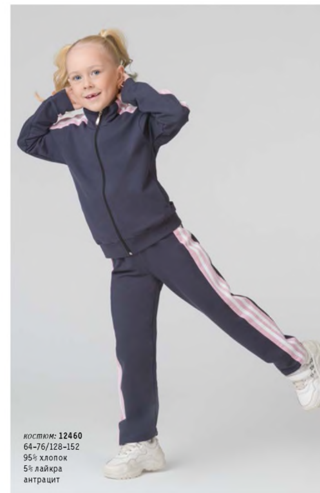
костюм: 12460 64-76/128-152 95% хлопок 5% лайкра антрацит