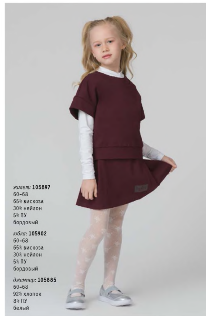
жилет: 105897 60-68 65% вискоза 30% нейлон 5% ПУ бордовый