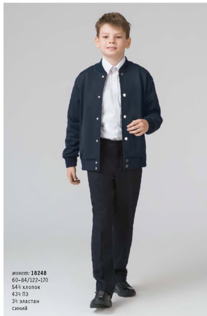
жакет: 18248 60-84/122-170 54% хлопок 43% ПЭ 3% эластан синий