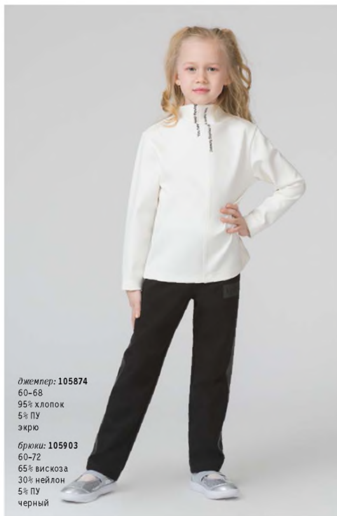
джерсер: 105874 60-68 95% хлопок 5% ПУ экрю брюки: 105903 60-72 65% вискоза 30% нейлон 5% ПУ черный