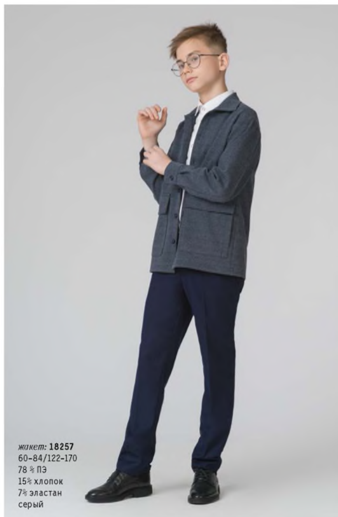
жакет: 18257 60-84/122-170 78% ПЭ 15% хлопок 7% эластан серый