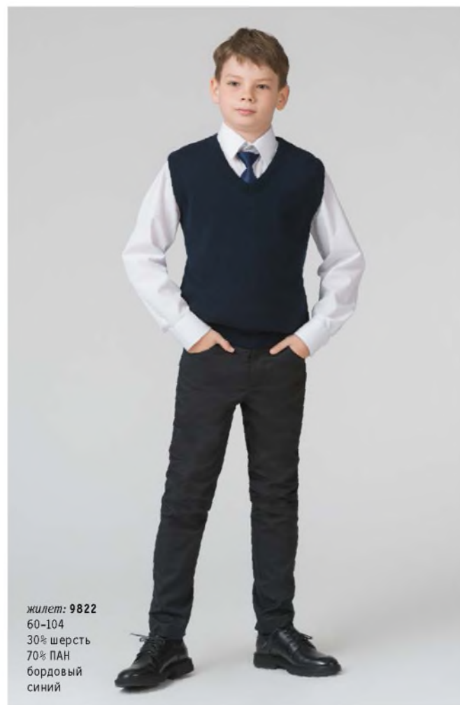
жилет: 9822 60-104 30% шерсть 70% ПАН бордовый синий