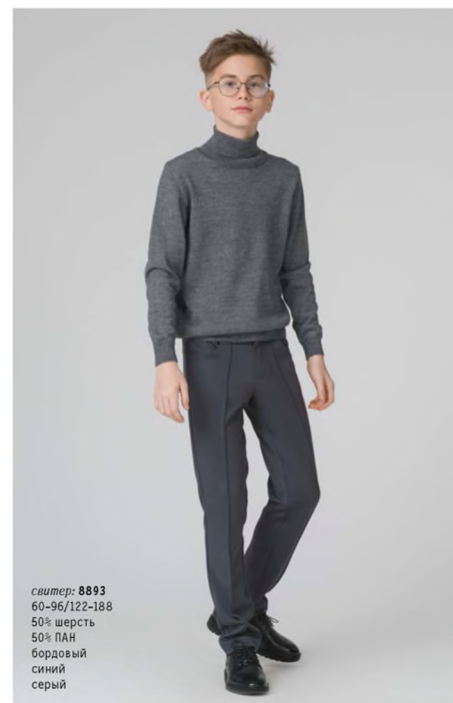
свитер: 8893 60-96/122-188 50% шерсть 50% ПАН бордовый синий серый