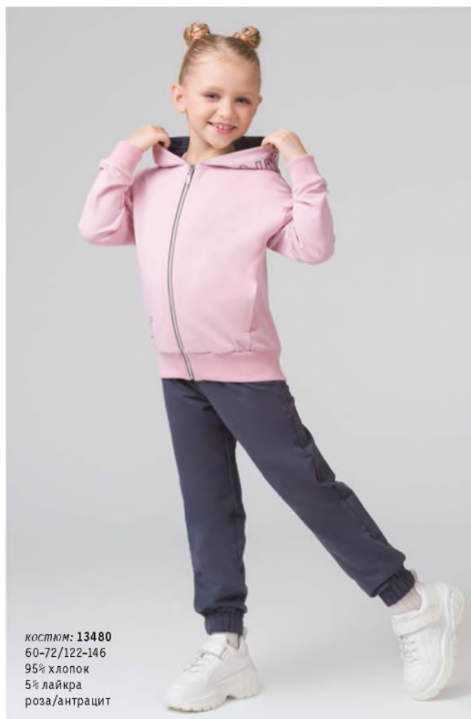
костюм: 13480 60-72/122-146 95% хлопок 5% лайкра роза/антрацит