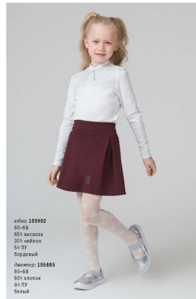
юбка: 105902 60-68 65% вискоза 30% нейлон 5% ПУ бордовый