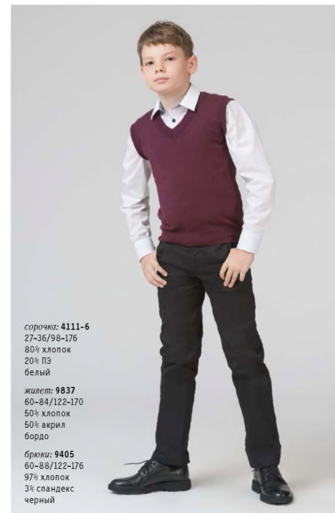
сорочка: 4111-6 27-36/98-176 80% хлопок 20% ПЭ белый жилет: 9837 60-84/122-170 50% хлопок 50% акрил бордо брюки: 9405 60-88/122-176 97% хлопок 3% спандекс черный