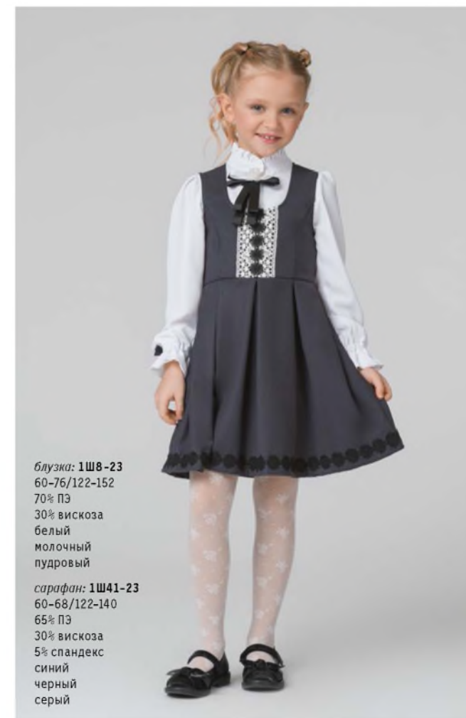
блузка: 1Ш8-23 60-76/122-152 70% ПЭ 30% вискоза белый молочный пудровый сарафан: 1Ш41-23 60-68/122-140 65% ПЭ 30% вискоза 5% спандекс синий черный серый

Школьная форма – от бренда TAMMI форма, которую захотят носить наши дети.