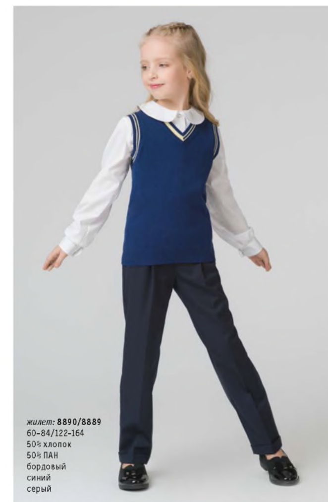
жилет: 8890/8889 60-84/122-164 50% хлопок 50% ПАН бордовый синий серый