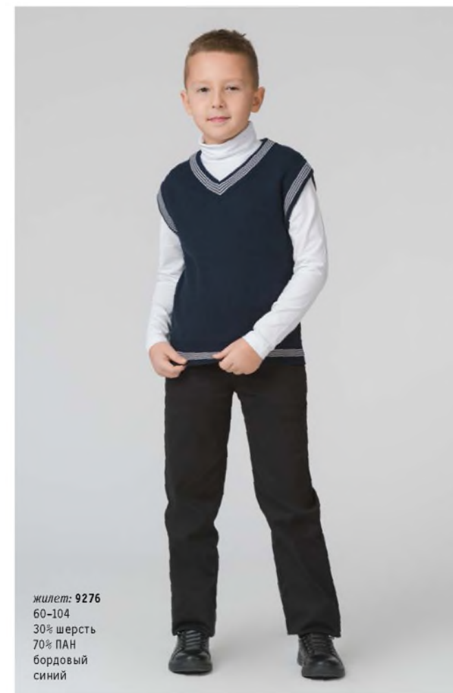
жилет: 9276 60-104 30% шерсть 70% ПАН бордовый синий