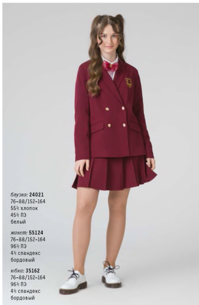
блузка: 24021 76-88/152-164 55% хлопок 45% ПЭ белый жакет: 55124 76-88/152-164 96% ПЭ 4% спандекс бордовый юбка: 35162 76-88/152-164 96% ПЭ 4% спандекс бордовый