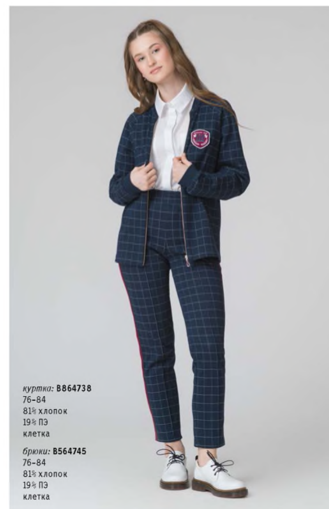
куртка: B864738 76-84 81% хлопок 19% ПЭ клетка