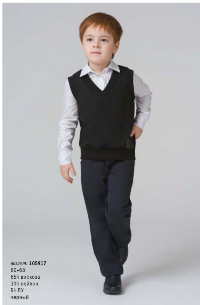
жилет: 105917 60-68 65% вискоза 30% нейлон 5% ПУ черный