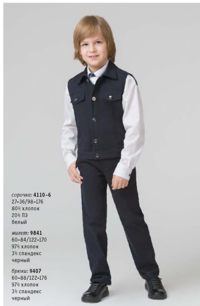
сорочка: 4110-6 27-36/98-176 80% хлопок 20% ПЭ белый жилет: 9841 60-84/122-170 97% хлопок 3% спандекс черный брюки: 9407 60-88/122-176 97% хлопок 3% спандекс черный