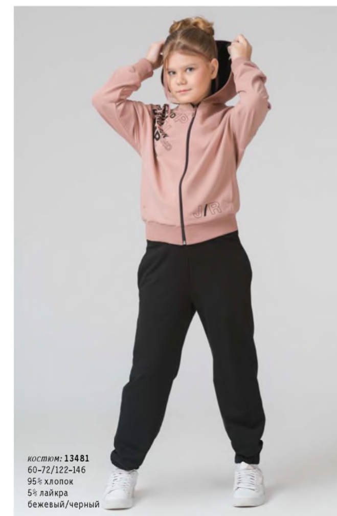
костюм: 13481 60-72/122-146 95% хлопок 5% лайкра бежевый/черный