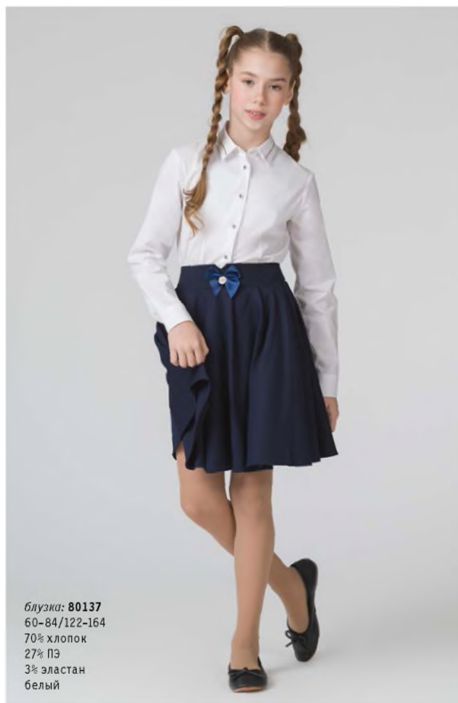
блузка: 80137 60-84/122-164 70% хлопок 27% ПЭ 3% эластан белый