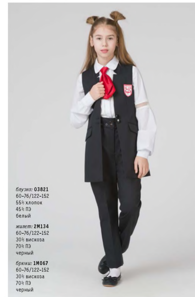
блузка: 03821 60-76/122-152 55% хлопок 45% ПЭ белый жилет: 2M134 60-76/122-152 30% вискоза 70% ПЭ черный брюки: 1M067 60-76/122-152 30% вискоза 70% ПЭ черный