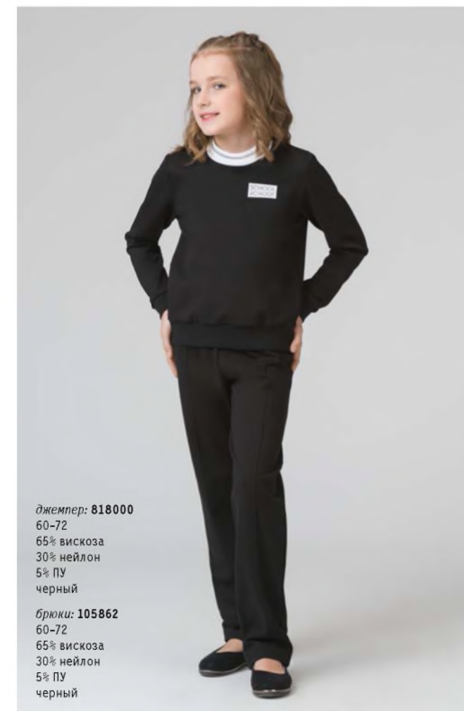
джерсер: 818000 60-72 65% вискоза 30% нейлон 5% ПУ черный