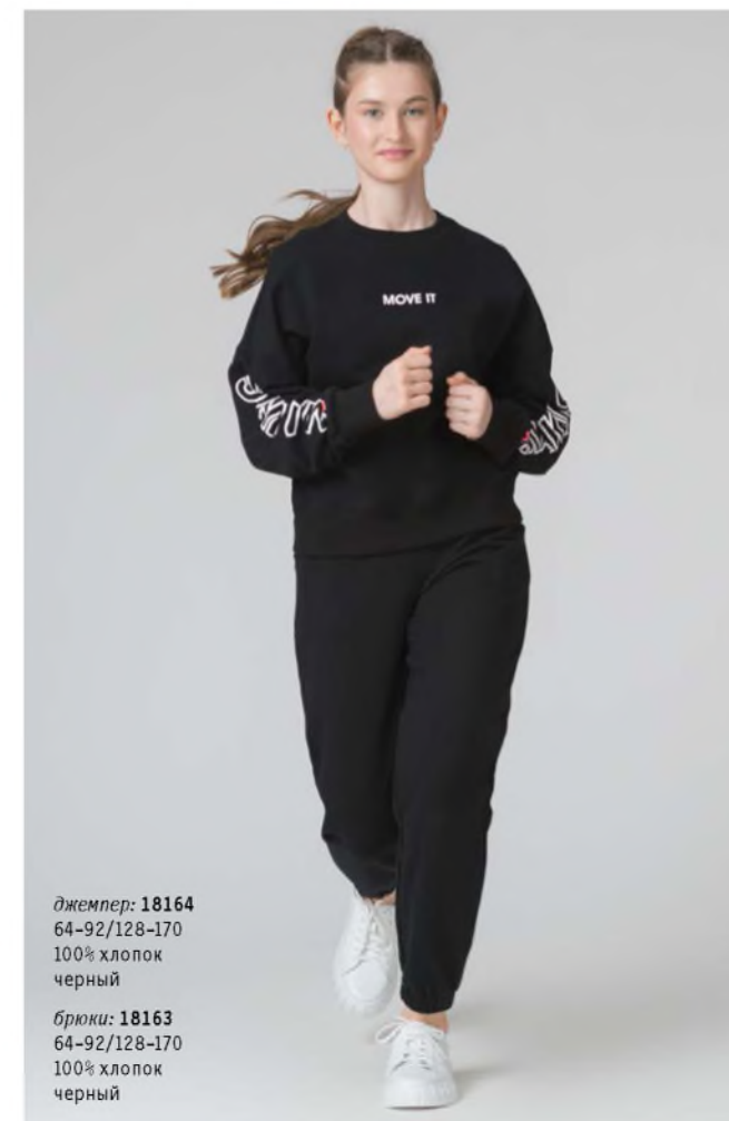
Джемпер: 18164 64-92/128-170 100% хлопок черный Брюки: 18163 64-92/128-170 100% хлопок черный