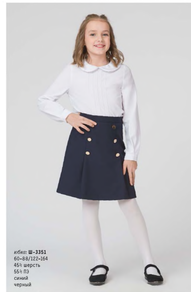
юбка: Ш-3351 60-88/122-164 45% шерсть 55% ПЭ синий черный